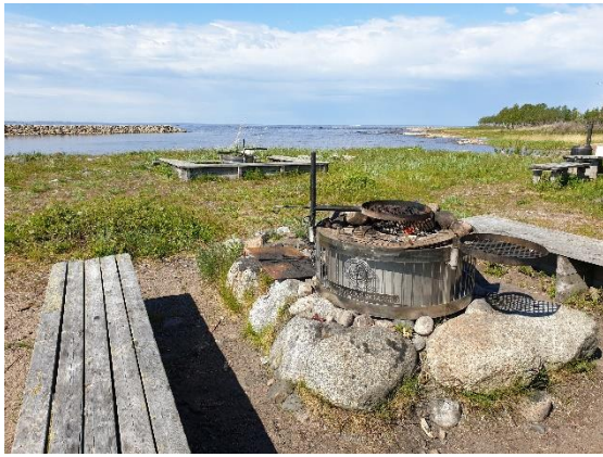
Bottenvikens skärgårds eldstäder finns bland annat på Haparanda Sandskär.