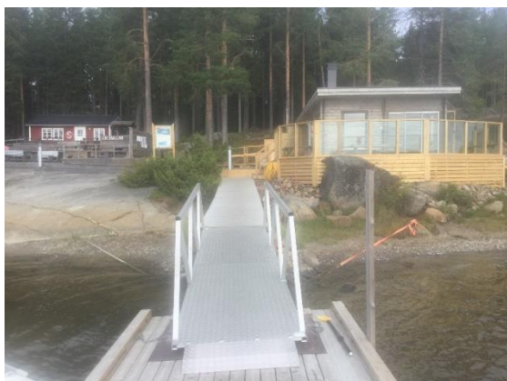
Tillgänglighetsanpassad landgång och bastu på Lillhällan, Skellefteå kommun.

Då nuvarande strategi sträcker sig till och med 2020 har ett stort fokus under året legat på förberedelser av framtagande av en ny strategi. Strategin ska tas fram med berörda aktörer. Målet är att skapa förutsättningar för en känd, tillgänglig och attraktiv kust och skärgård i Bottenviken.