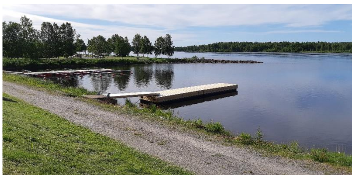
Strandängarna i Kalix har utrustats med en flytbrygga.

Under en studieresa i augusti träffade samordnare, styrgrupp och arbetsgrupp representanter för landskapsregering, kommuner, boende och entreprenörer på Åland.