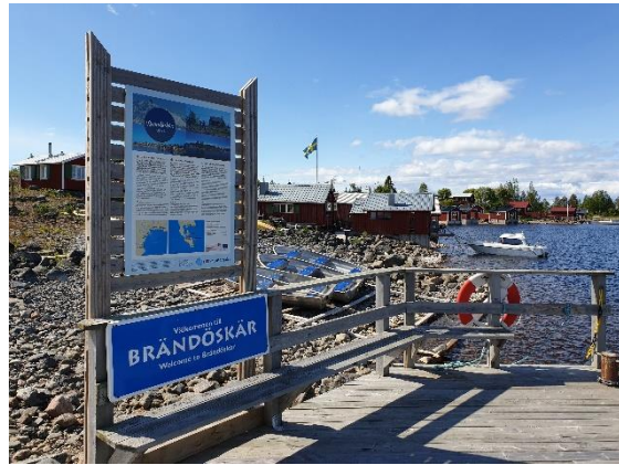
Välkommen till Brändöskär i Luleå kommun! Skylt uppsatt i projekt Basskyltning i Bottenvikens skärgård.

Under en studieresa i augusti träffade samordnare, styrgrupp och arbetsgrupp representanter för landskapsregering, kommuner, boende och entreprenörer på Åland.