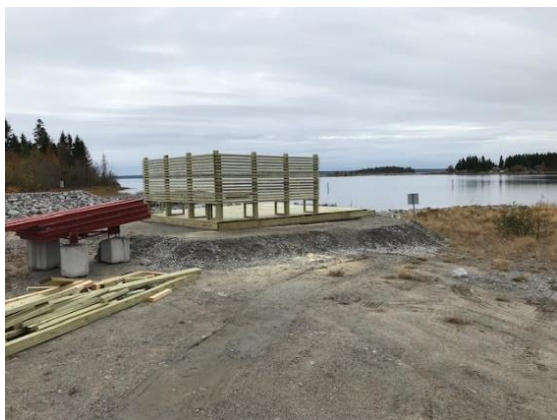
Uppbyggnad av grillplats vid Bondökanalen, Piteå kommun.

Haparanda, Kalix, Luleå, Piteå och Skellefteå kommuner arbetar tillsammans med att utveckla skärgården så att boende, besökare samt företag inom besöksnäringen ska få bättre förutsättningar för friluftsliv, välmående och företagande. Arbetet sker utifrån en gemensam strategi, Bottenvikens skärgård – en del av Swedish Lapland , med sikte på att göra skärgården till en hållbar destination med stor attraktionskraft.