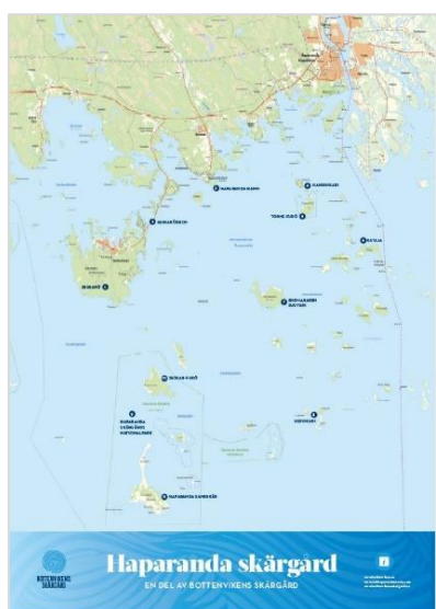
En informationskarta över Haparanda skärgård kan ge inspiration till utflykter.

Eldstäder har placerats vid småbåtshamnen vid Bondö marina i Piteå och i Nördharaholmen. I Skellefteå skärgård har Gumhamnshällan, Kallviken och Lillänget fått nya eldstäder.