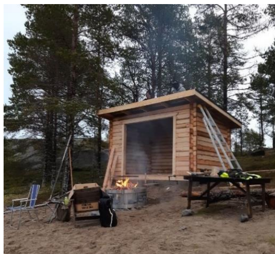
På Juvikskäret i sydligaste Skellefteå skärgård har ett vindskydd byggts i projekt besöksmålsutveckling.

I Luleå Skärgård har antalet eldstäder utökats, bland annat på Stensborg, Hindersön, Altappen och Klubbviken. En ny bastustuga har byggts Brändöskär och bastun på Antnäs-Börstskär har fått nytt bastuaggregat.