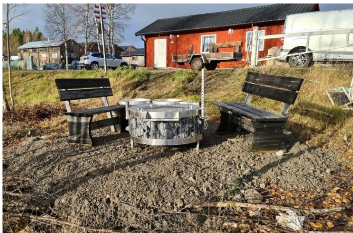
I projekt besöksmålsutveckling har en ny grillplats anlagts i Renöhamn i Piteåkusten.

Liksom övriga i samhället har verksamheten i Bottenvikens skärgård kommunsamverkan påverkats av Corona-pandemin vilket gjort att planerade insatser genomförts på ett annat sätt eller inte kunnat genomföras alls. Skärgårdsutvecklingen har dock gått framåt på flera olika sätt. Till att börja med