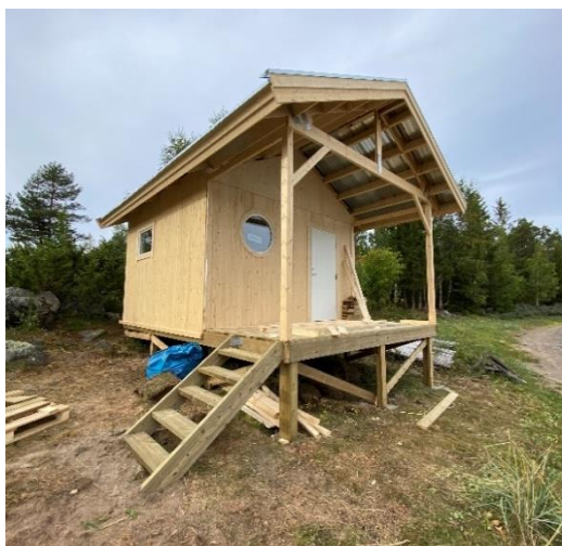
Bastu under uppbyggnad på Brändöskär i Luleå skärgård.