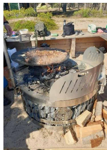
Stranden på Halsön i Kalix skärgård har fått grillplatser. Nytt för i år är att många grillar försetts med vindskyddande läplåt.

En skärgårdsguide, Din guide till 100 pärlor i Bottenviken , har tagits fram och finns på svenska och engelska . Guiden innehåller beskrivningar av vår unika skärgård, fakta, kartor och bilder från ett stort antal besöksmål i området och finns även hos turistcenters samt på sidan Bottenviken.se . Samarbetet med webbsidan www.bottenviken.se har fortsatt och sidan har uppdaterats under året för att fungera bättre i mobiltelefoner.