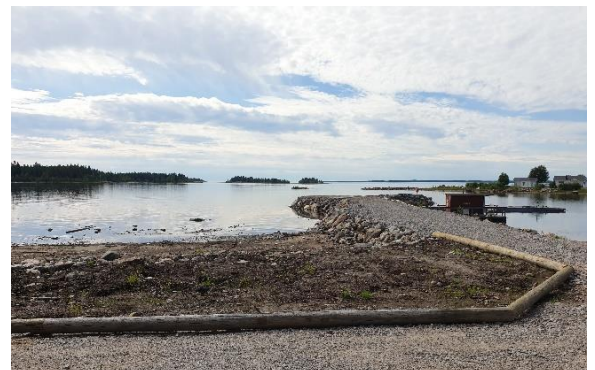
Inom projekt Besöksmålsutveckling i Bottenvikens skärgård har småbåtshamnen i Båtvik i Skellefteå skärgård försetts med grillplats, badstranden har rensats och piren har förlängts.

Utöver arbetet med den nya strategin har