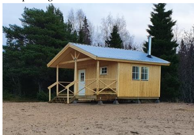
Den nya bastun på Kluntarna i Luleå skärgård är redo för sköna bastubad.

Kontakta oss så får du veta mer! Du hittar kontaktinformation på www.bottenvikensskargard.se .