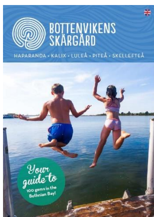
Your guide to 100 gems in the Bothnian Bay.

En skärgårdsguide, Din guide till 100 pärlor i Bottenviken , har tagits fram och finns på svenska och engelska . Guiden innehåller beskrivningar av vår unika skärgård, fakta, kartor och bilder från ett stort antal besöksmål i området och finns även hos turistcenters samt på sidan Bottenviken.se . Samarbetet med webbsidan www.bottenviken.se har fortsatt och sidan har uppdaterats under året för att fungera bättre i mobiltelefoner.