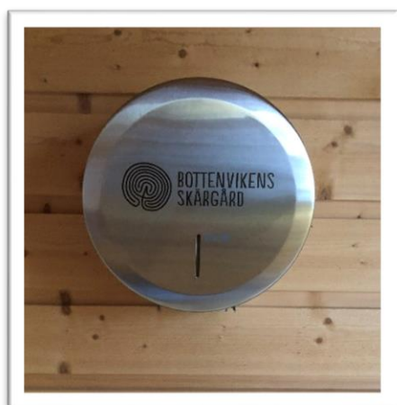
Kanske på ett torrdass nära dig?

För att skapa igenkänning inom Bottenvikskusten finns numera, vid sidan av skärgårdsguinen och skärgårdsgrillen, även Bottenvikens skärgårds alldeles egna toalettappershållare.