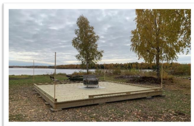
På Vassholmen i Kalix har grunden lagts för en tillgänglighetsanpassad grillplats inom LONA-projektet.

I slutet av året lämnades en LONA-ansökan för projekt Upptäck sportfisket i Bottenvikens kust och skärgård som snabbt beviljades av Länsstyrelsen i Västerbotten. Projektet startar under 2023.