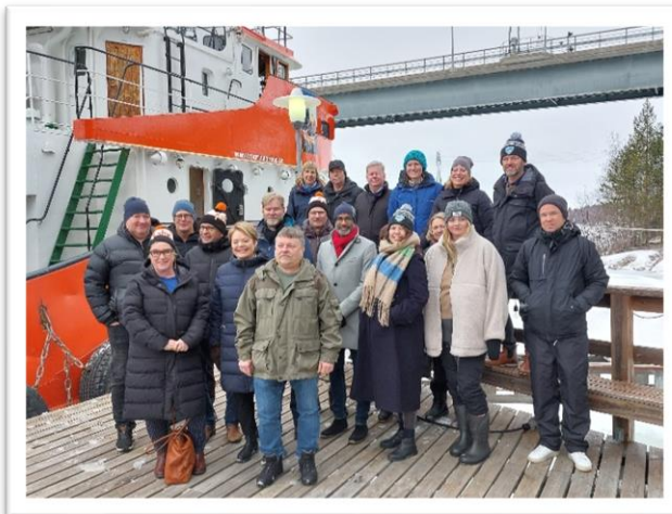
Högnivåmöte i Piteå om skärgårdssamarbete.

Både den svenska och den engelska versionen av skärgårdsguiden Din guide till 100 pärlor i Bottenviken har uppdaterats och för att specifikt berätta om turbåtar och boende ute i skärgården i hela Bottenvikens kustområde har en sammanställning om detta gjorts. Nytt för i år är en beskrivning av vad som