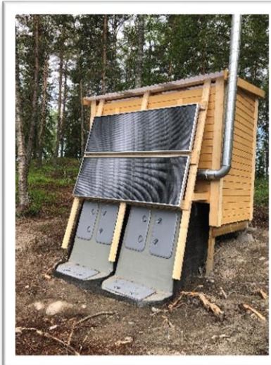
I ett av LONA-projekten testas ett solcellsdrivet förmultningsdass.