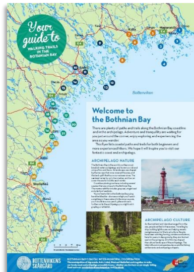
LONA: En karta som visar på vandringsleder ska inspirera till nya upptäckter.

I Piteå skärgård har bastun på Fingermanholmen stabiliserats upp och fått ny grundläggning och i förtöjningsöglor och toalett-pappershållare med Bottenvikens skärgård logotyp finns numera i Piteå segelsälls kaps hamn. En ny skärgårdsgrill har placerats på Mellerstön.