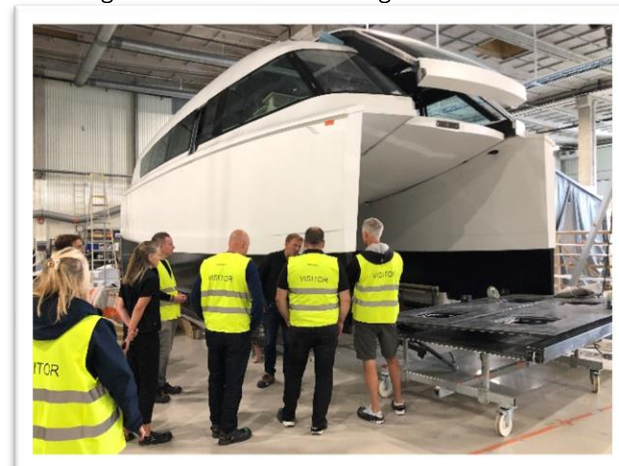
Region Stockholm och Candela har ett intressant projekt om eldriven skärgårdstrafik i Stockholm.