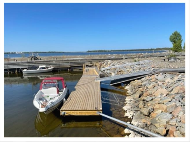
På Gåsören bidrar en ny stadig brygga till ytterligare tillgänglighetsanpassning.

Insatser för att skapa en tillgänglig och trevlig skärgård har fortsatt. I Haparanda skärgård har skyltar med information om turbåtstrafiken satts upp och i Kalix skärgård har eldstäder av modellen skärgårdsgrillen placerats ut på Frevisören, Stora Trutskär och Vassholmen.