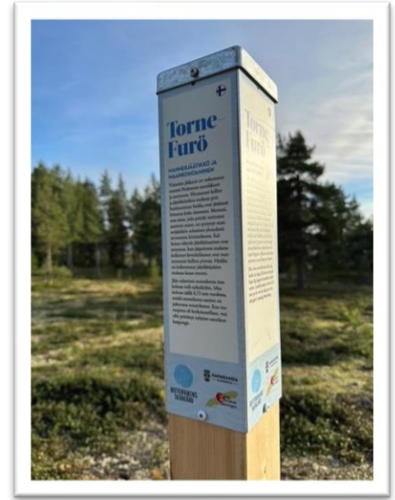
Informationsskylt på Torne-Furö

I Piteå skärgård har Bondö marina byggt en bastu med Bottenvikens skärgårdsugn och kommunen har rustat upp enslinjer i farlederna.