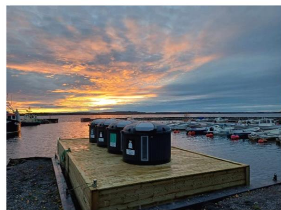
Luleås miljöbrygga ska ligga i Junköns hamn

Under en studieresa till Tjörn och Stockholm låg fokus på klimatsmart