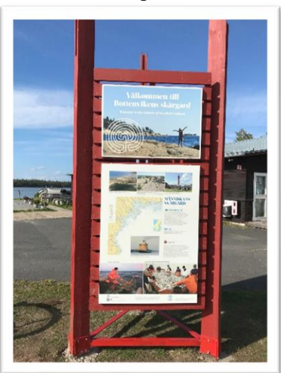
En ny skylt ute på Frevisören berättar om Bottenvikens skärgård