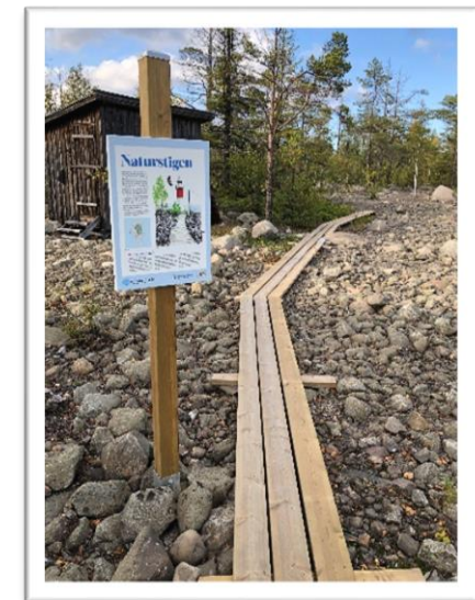
Naturstig och skylt på Gåsören