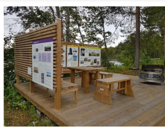
Ny grillplats på Fingermanholmen

skärgårdstrafik. Under resan träffade vi bland annat Region Stockholm och elbåttillverkarna Swede Ship Marine och Candela Technology.