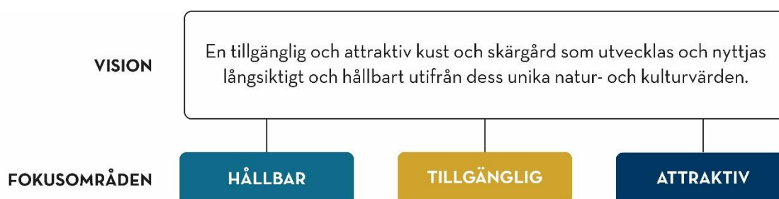
Figur 1. Bottenvikens skärgård kommunsamverkan 2021-2030, vision och fokusområden. Varje fokusområde innehåller tre mål.

Arbetet utgår från en gemensam strategi, " Bottenvikens skärgård 2021-2030 ", samt ett samarbetsavtal. Visionen är en tillgänglig och attraktiv kust och skärgård som utvecklas och nyttjas långsiktigt hållbart utifrån dess unika natur- och kulturvärden (se Figur 1).