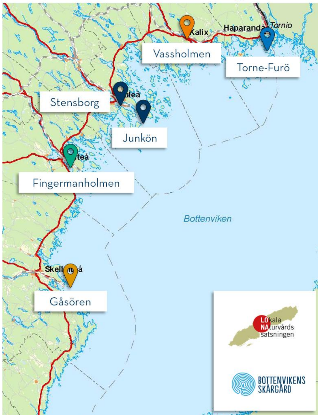
Figur 2. I projektet ingår sex besöksmål som utvecklats med olika typer av åtgärder.

Beskrivning av genomförda åtgärder i de olika delprojekten är under framtagande.